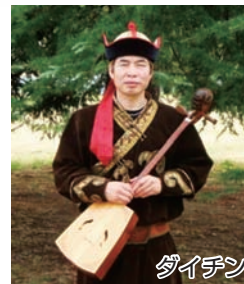
ダイチン (モンゴル)