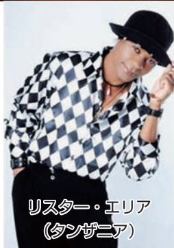
リスター・エリア (タンザニア)