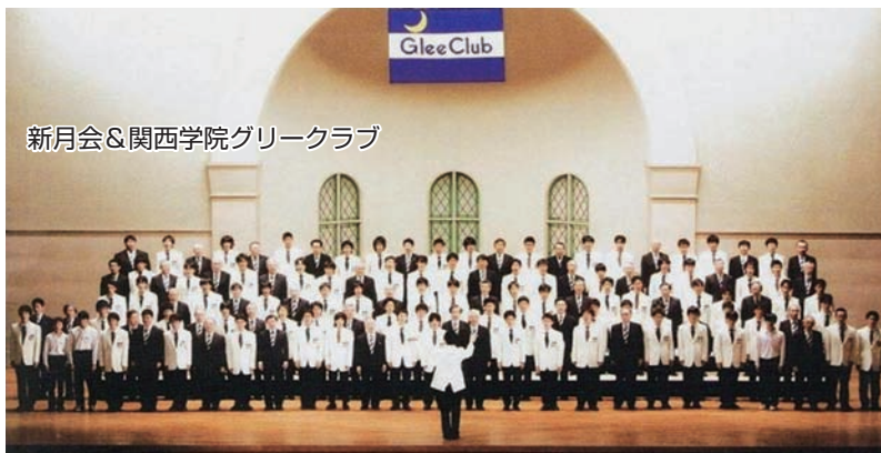
新月会&関西学院グリークラブ